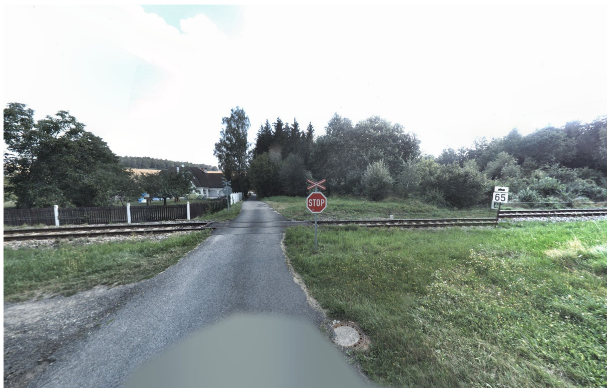
Pohled na přejezd PZZ km 23,011